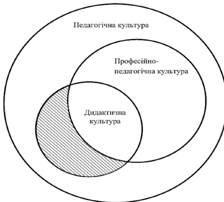
Рис.1. Співвідношення понять “педагогічна культура”, “професійно- педагогічна культура”, “дидактична культура”

(Рис.1). Носієм, суб'єктом дидактичної культури в нашому дослідженні виступає викладач вищого навчального закладу, який здійснює процес навчання в інноваційному режимі, що відповідає цілям і завданням сучасного навчального закладу.