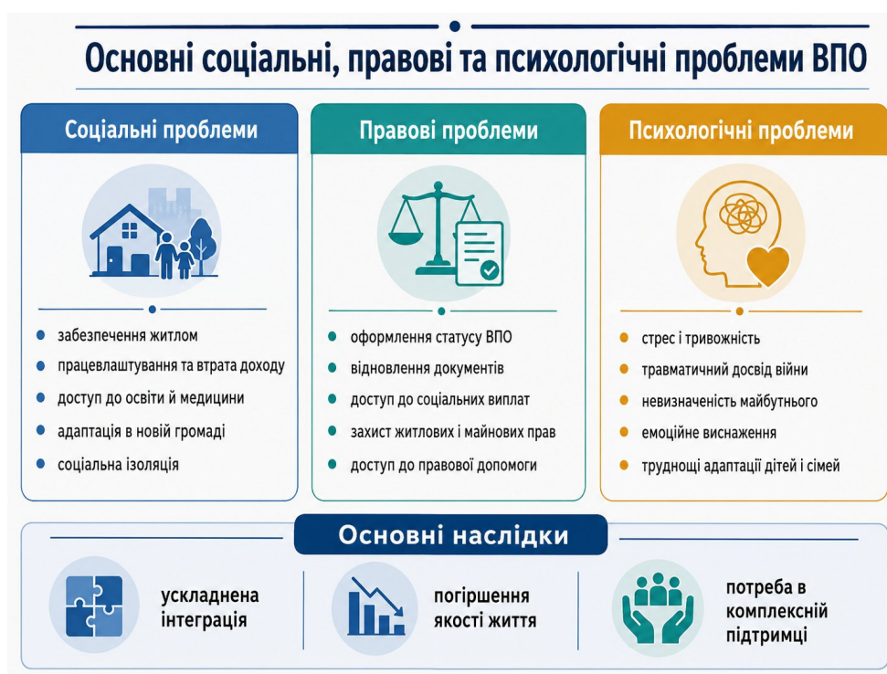
Рис 1.1. Проблеми ВПО

Значна частина дітей залишає окуповані території або райони активних бойових дій у складних умовах, інколи без належним чином оформлених документів чи нотаріальних доручень від батьків, перебуваючи в супроводі родичів або знайомих. Окрім травматичного впливу воєнних подій і самого переміщення, діти часто переживають розрив або послаблення зв'язків із найближчими людьми – батьками, опікунами чи іншими значущими дорослими. Такий досвід може негативно позначатися на їхньому емоційному стані, поведінці та здатності вибудовувати довірливі стосунки.