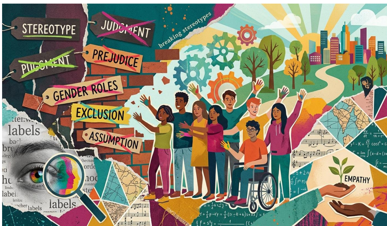
Рис. 2.2. Колаж «Світ без ярликів»

До прикладу, особливе зацікавлення викликають в учнів техніки, що передбачають створення колажів, які візуалізують реальний стан речей і ефективно спростовують поширені соціальні міфи. Представимо, створений ними колаж з допомогою ШІ.