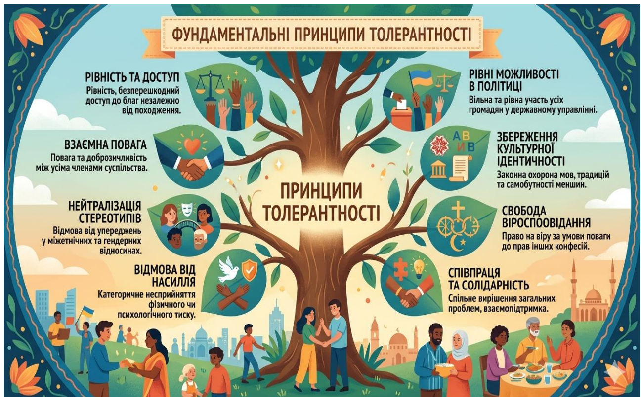
Рис. 1.1. Фундаментальні принципи толерантності

Схематично ці принципи зображено на рисунку 1.1., згенерованому ШІ.