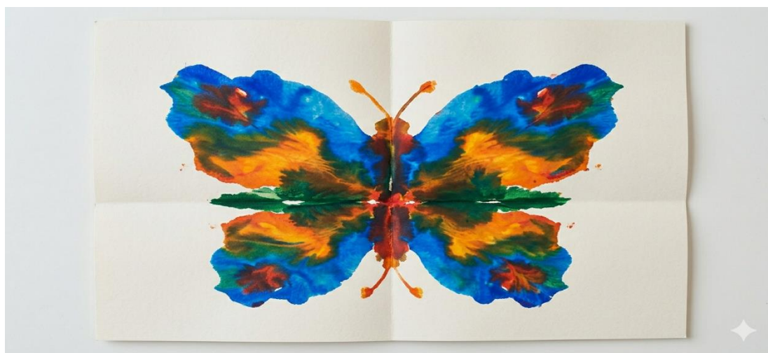
Рис.2.4. Метелик (згенеровано ШІ)

Для актуалізації адаптивного потенціалу та мобілізації прихованих особистісних ресурсів соціальний педагог інтегрує в структуру занять арттерапевтичний прийом Метелик.