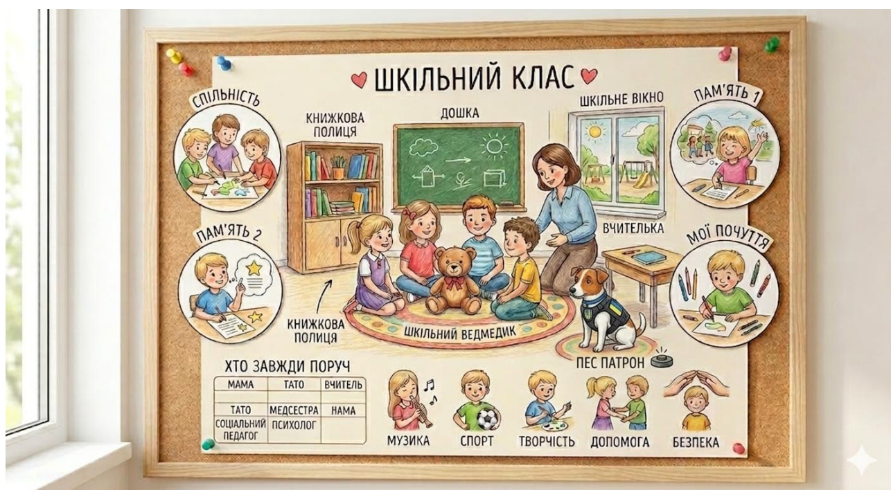
Рис.2.3. Мій безпечний простір (згенеровано ШІ)

Така підтримка здійснюється на тлі демонстрації фахівцем прикладів колажів чи малюнків, а також, що стосується особистого стану, – абсолютного самовладання, максимальної емоційної стійкості, спокійного чіткого голосу та стабільності міжособистісних кордонів.