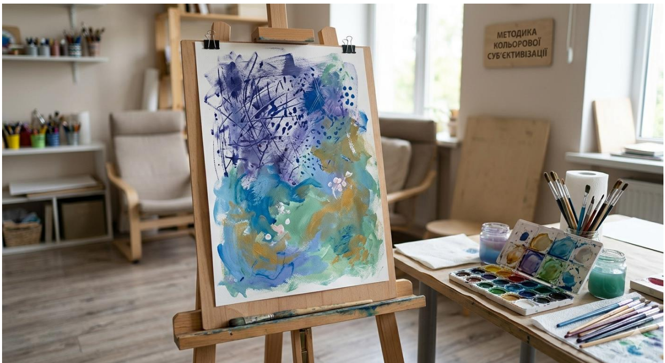
Рис. 2.2. Методика кольорової суб'єктивізації (рисунок згенеровано ШІ)

Методика кольорової суб'єктивізації (детально описана нами в розділі I, п.1.2.) реалізується шляхом послідовного виконання шести регламентованих етапів, де на початковій стадії здійснюється візуальний моніторинг палітри з метою інтуїтивного вибору кольору гуаші, який відображає поточний психологічний стан вихованця за принципом «тут-і-тепер» на закріпленому у вертикальному положенні аркуші паперу формату А3.