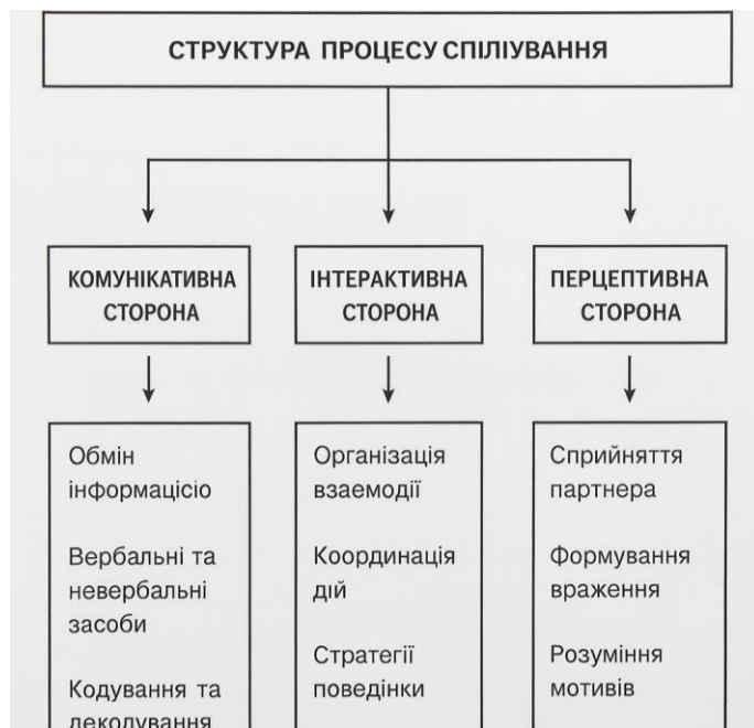
Рис 1.1 Структура процесу спілкування

Структура спілкування традиційно розглядається через призму трьох взаємопов'язаних сторін: комунікативної, інтерактивної та перцептивної. Комунікативна сторона спілкування передбачає обмін інформацією, смислами та значеннями між учасниками взаємодії через вербальні та невербальні канали передачі повідомлень. Інтерактивна сторона відображає організацію взаємодії, координацію спільних дій та встановлення певних форм співпраці або протистояння. Перцептивна сторона пов'язана зі сприйняттям, пізнанням та розумінням партнерів по спілкуванню, формуванням образу іншої людини та інтерпретацією її поведінки.