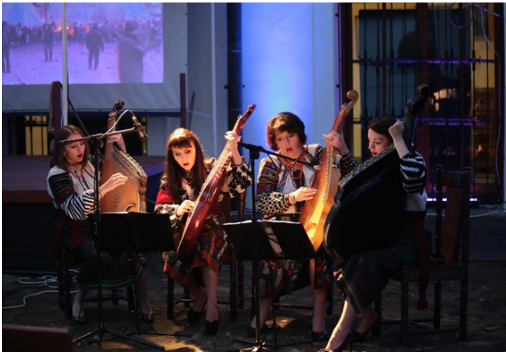
Рис. 4. Квартет «Гердан» у проєкті «Культурні претексти», Жешів, 2015 р.