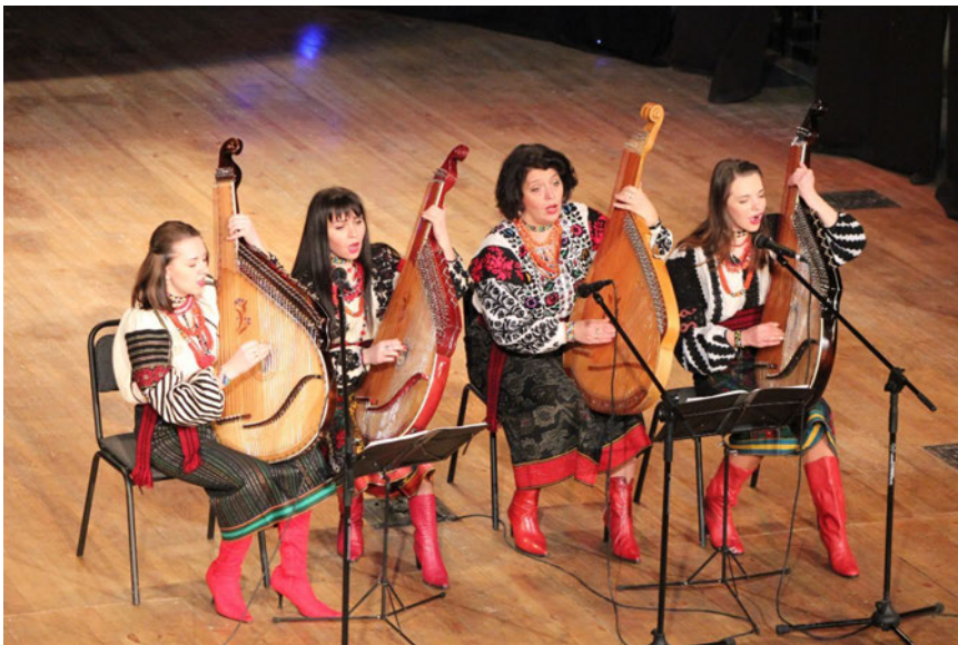
Рис. 1. Квартет бандуристок «Гердан», Івано-Франківськ, 2017 р.

Однак, на думку самих бандуристок, своєрідним лейтмотивом творчості квартету «Гердан» стала «Квітка душа» К. Меладзе до слів Д. Гольде. Як і згадана пісня, практично уся музика ансамблю пронизана надзвичайною енергетикою добра, позитиву та жіночності, що проявляються у витонченій та елегантній виконавській манері бандуристок.