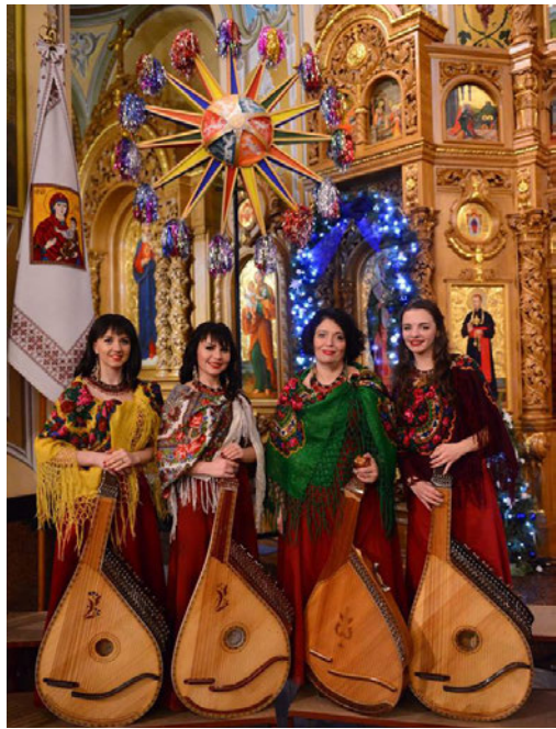
Рис. 2. Квартет «Гердан» на фестивалі «Коляда на Майзлях», 2019 р.

Яскраві костюми, сильні голоси, блискучий звук бандур учасниць колективу був надзвичайно тепло прийнятий слухачами, всі духовні й патріотичні твори були щиро підтримані оплесками і вигуками «браво». Особливо зворушливо була сприйнята пісня «Біля тополі» (сл. і муз. П. Солодухи, аранжування В. Дутчак – О. Б.), присвячена всім героям і мученикам за Україну, після звучання якої зал стоячи вітав бандуристок (Застава, 2017).