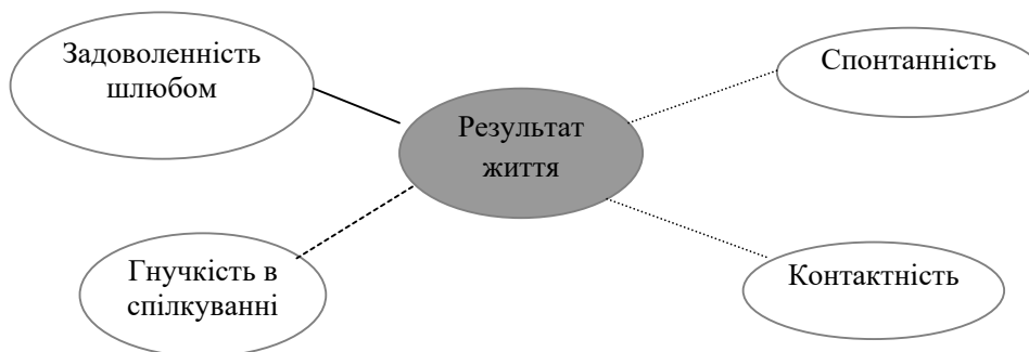
Рис. 2. Кореляційна плеяда «Результативність життя»

ного «Я» у стосунках, можливості реалізації внутрішніх якостей та реалізації моделей саморозвитку власної особистості та сім'ї загалом.