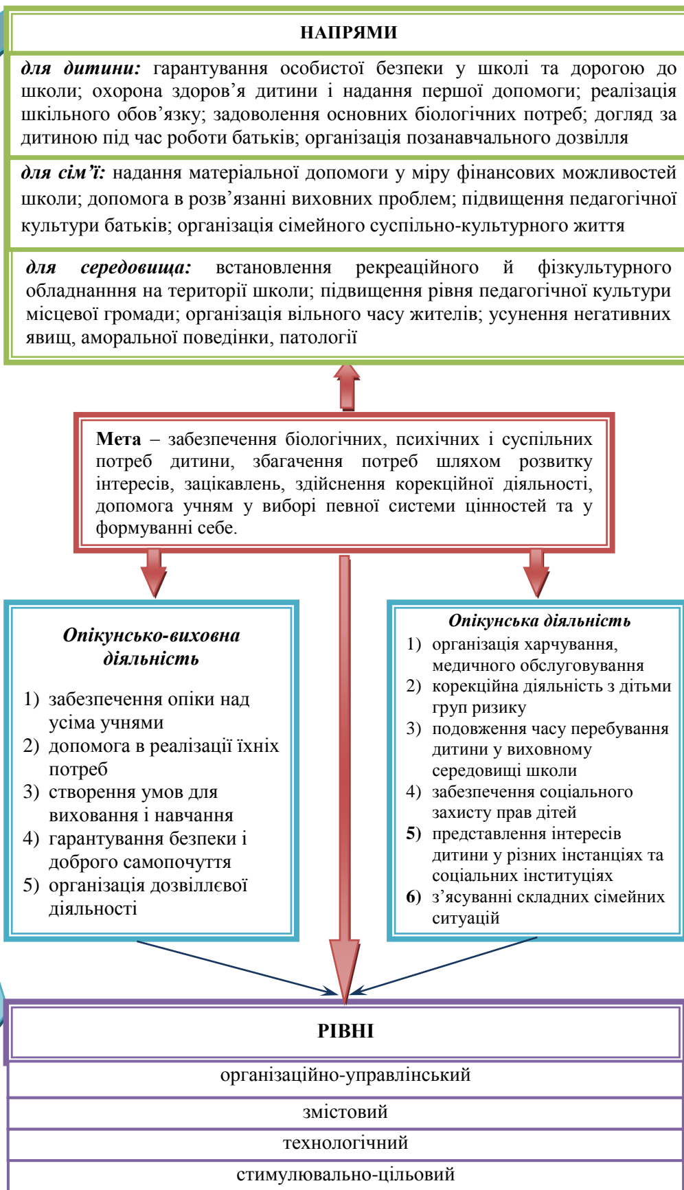
Рис.2. Модель опікунсько-виховної діяльності школи