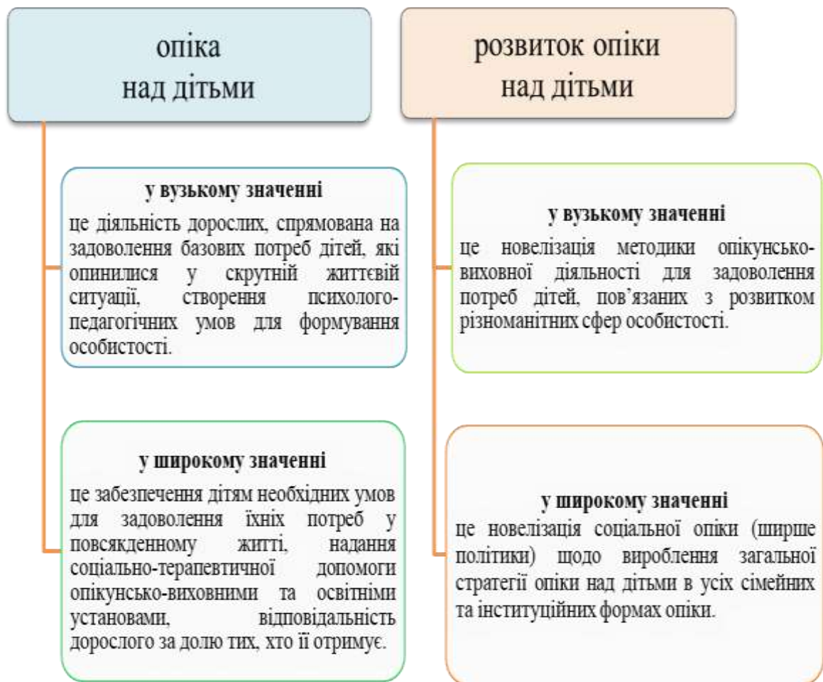
Рис. 1. Авторське визначення базових понять

Під час вивчення другого питання необхідно пам'ятати, що опіка та піклування – це інститути цивільного права, тому варто звернутися до Цивільного (ЦК) та Сімейного Кодексів (СК) України. У ЦК главі 6 «Опіка та піклування» статті 55–79 регулюють: діяльність органів опіки та піклування; порядок призначення опікуна, його права й обов'язки та його підопічного; припинення опіки та піклування. У ЦК главі 17 «Представництво» розкрито підстави для передоручення, форми та строки довіреності, а також її скасування. У СК варто зацентувати увагу на Розділі IV «Влаштування дітей-сиріт і дітей, позбавлених батьківського піклування». Він охоплює такі питання: «Усиновлення» (гл. 18), «Опіка та піклування над дітьми» (гл. 19), «Патронат над дітьми» (гл. 20), «Прийомна сім'я» (гл. 20-1), «Дитячий будинок сімейного типу» (гл. 20-2). Детальніше рекомендуємо розглянути статті 243–251, які регулюють: осіб (дітей), над якими встановлюється опіка;