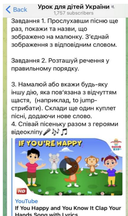
Рис.2. Скриншот методичних рекомендацій у телеграм-каналі

Очевидно, що останній етап охоплює творчу та комунікативну діяльність дітей на основі запропонованого пісенного відеоматеріалу. Залежно від специфіки відеокліпу та змісту пісні завдання цього етапу варіюються, тому передбачають малювання, танцювальні рухи, наспівування в «Караоке» або рольові ігри. Варто зауважити, що завдання такого характеру поєднують сучасні методи та підходи в навчанні англійської мови, зокрема комунікативно-ігровий метод, діяльнісний метод, проєктну роботу, інтегроване навчання, метод повної фізичної реакції, метод драматизації, ед'ютейнмент та ін. У таблиці нижче подаємо та аналізуємо добірку запропонованих англійськомовних відеокліпів YouTube для дітей молодшого шкільного віку в телеграм-каналі, які передбачають вивчення лексичних одиниць та мовленнєвих зразків.