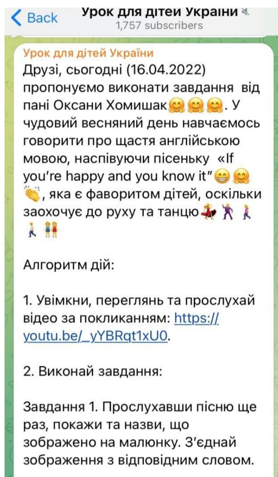
Рис. 1. Скриншот методичних рекомендацій у телеграм-каналі

Тож спочатку ми пропонуємо батькам і дітям увімкнути відеокліп YouTube, переглянути та слухати його двічі без використання перекладу, підготовчої роботи зі зняття лексичних або граматичних труднощів для емоційної бадьорості, зацікавленості дітей, створення атмосфери невимушеності, переключення уваги, практикуючи водночас технологію занурення в іншомовне середовище. Проілюструємо наші методичні поради на основі відеокліпу « If you are happy and you know it » (рис. 1).