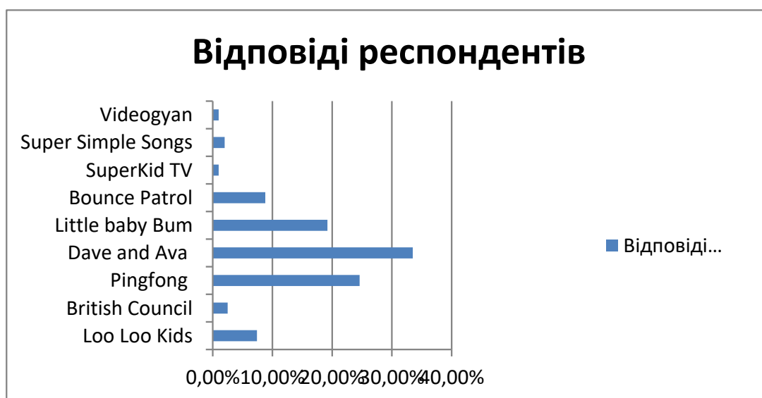
Рис. 6. Результати опитування батьків щодо улюбленого англомовного YouTube-каналу дітей

В анкеті також було запитання, яке стосувалось уподобань дітей щодо дитячих YouTube-каналів. Відповіді респондентів подаємо нижче (рис. 6):