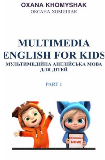
Рис. 7. Титульна сторінка посібника

Посібник презентує ряд популярних англomовних дитячих пісень (“Apples and bananas”, “Five little monkeys”, “Head, shoulders, knees and toes”, “Happy Birthday to you” та ін.) для формування англomовної комунікативної компетентності дітей у межах особистісної та публічної сфер спілкування на основі відеокліпів всесвітньовідомого YouTube-каналу «Dave і Ava». У відеосюжеті є двоє головних героїв-цукенят Дейв і Ейва, які граються зі своїми друзями та вивчають абетку, цифри, звуки, кольори, назви тварин, їжу англійською мовою. Матеріали посібника адресовані батьками, які мають базовий рівень знань англійської мови та прагнуть самотужки навчити дитину спілкуватися англійською мовою у легкій та привабливій манері за допомогою відеокліпів дитячого YouTube-каналу.