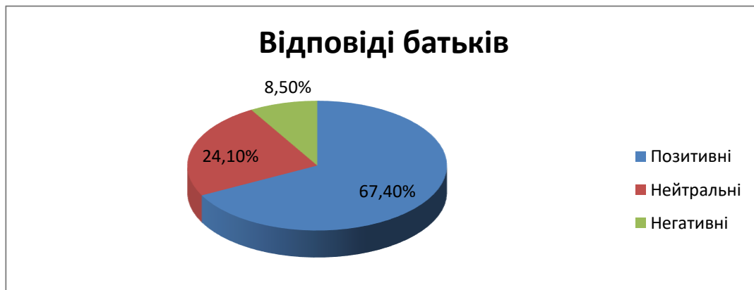
Рис. 5. Результати опитування дорослих щодо емоцій дитини після використання англомовних відеокліпів YouTube під час воєнних дій

негативні дитячі емоції після перегляду, слухання та опрацювання англомовних дитячих відеопісень (рис. 5).