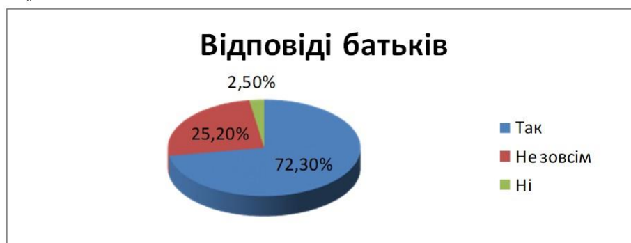
Рис. 3. Результати опитування батьків щодо ефективності використання англomовних відеокліпів YouTube задля переключення уваги дітей під час війни

Відповіді респондентів на перше запитання щодо ефективності використання англomовних відеокліпів YouTube були такі: 72,3% – відповіді «так»; 25,2% – відповіді «не зовсім»; 2,5% – дали негативну відповідь (див. рис. 3). Тож, відповідно, зазначимо, що більшість батьків підтвердила доцільність застосування англomовного пісенного відеоматеріалу YouTube задля психоемоційного відновлення дітей в умовах бойових дій.