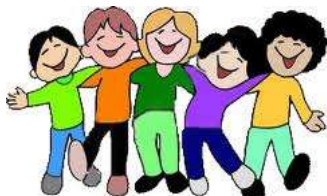
Схема психолого-педагогічної характеристики класного колективу

1. Склад класу за віком, національністю і статтю.