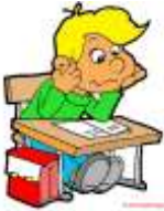
Схема психолого-педагогічної характеристики учня