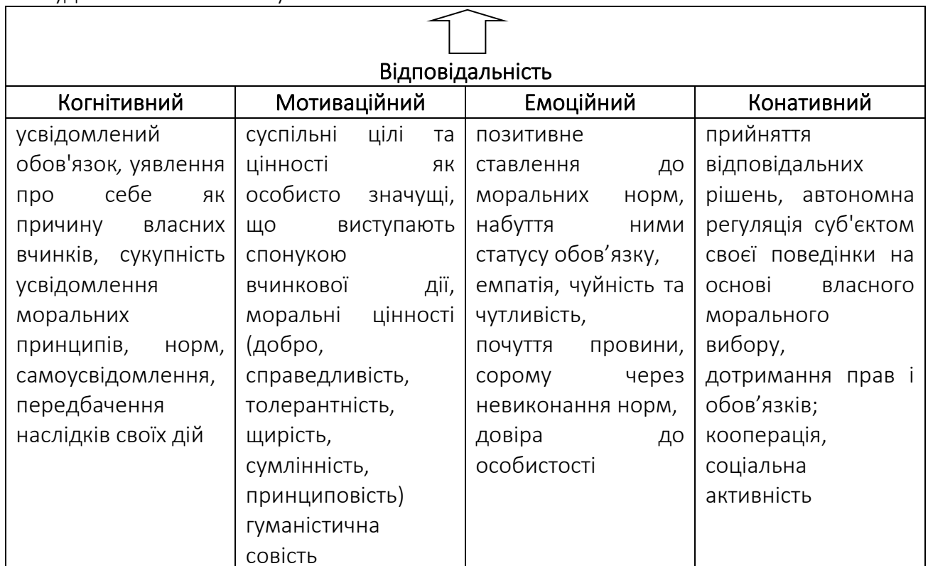
Рис. 1. Модель відповідальності особистості

Відповідальність є багатокомпонентним, інтегральним утворенням особистості, яке виступає однією з центральних особистісних характеристик, що визначає стиль життя, дає можливість особистості оптимально розв'язувати суперечності й складності життя. Структуру відповідальності можна представити як єдність когнітивного, емоційного, мотиваційного та конативного компонентів та яка може виявлятися на різних рівнях – ситуативному, рівні стійкої особистісної якості, а в найбільш розвиненому вигляді виступати основою організації життєдіяльності й побудови життєвого шляху особистості.