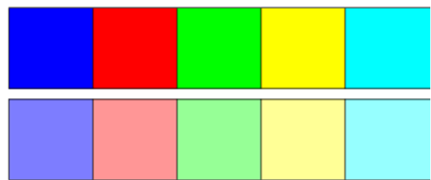
Рис. 2. Деякі монохроматичні кольори спектра (верхній ряд) та їх суміш з білим кольором (нижній ряд)

Монохроматичне випромінювання можна побачити лише в окремих випадках, наприклад, коли розглядати спектр у спектроскоп або спостерігати за світлом, яке випромінює лазер. Зазвичай в око людини потрапляє світловий потік змішаного складу, який містить промені всіх довжин хвиль, усіх кольорів спектра. Однак ця складність спектрального складу, різноманітність довжин хвиль зором не визначається. Людина завжди сприймає один певний колір. У цьому й полягає істотна відмінність між зором та слухом: слухаючи складний акорд, який містить декілька нот різної висоти, людина може виокремити кожен звук, а музикант точно назве всі ноти, які звучать. Для зору таке не є притаманним: для нього всі електромагнітні хвилі видимої частини спектра зливаються в єдиний колір, в якому окремі компоненти ніяк не розрізняються. Суміш кількох кольорів сприймається зором як новий колір. Важливо наголосити про випадок змішування монохроматичного та білого світла. Таке змішування дає бліді кольори, які ми зазвичай і бачимо (рис. 2).