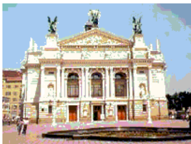
Львів. Театр опери та балету ім. Соломії Крушельницької. 1897 – 1900

7. Харчова промисловість України: Стан та перспективи. / За ред. акад. Юхновського І.Р. – К., 2001. – С.208.