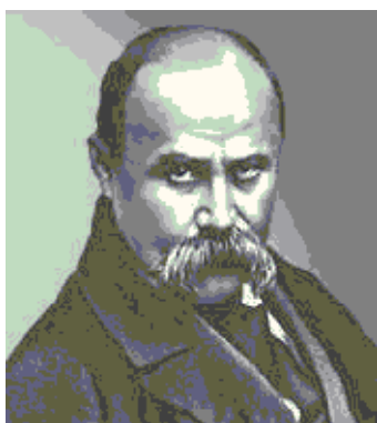
Тарас Шевченко (1814 – 1861 рр.)

17. Шпак О.Т., Падалка О.С., Шепетько В.П. Учителю про економічне виховання учнів: питання генезису і компетентності. – К.: Четверта хвиля, 1998. – 224 с.