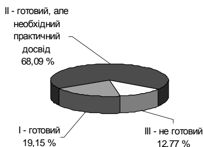
До вивчення курсу